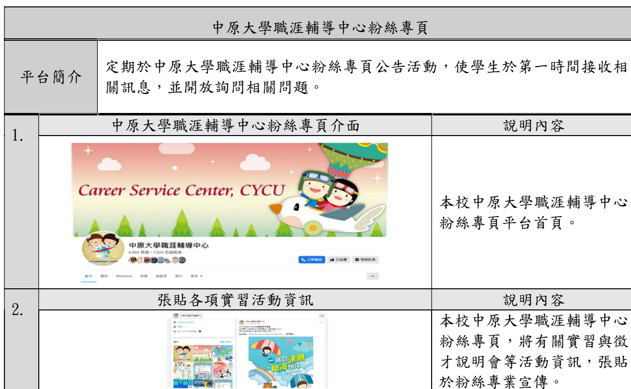
表9 中原大學職涯輔導中心粉絲專頁