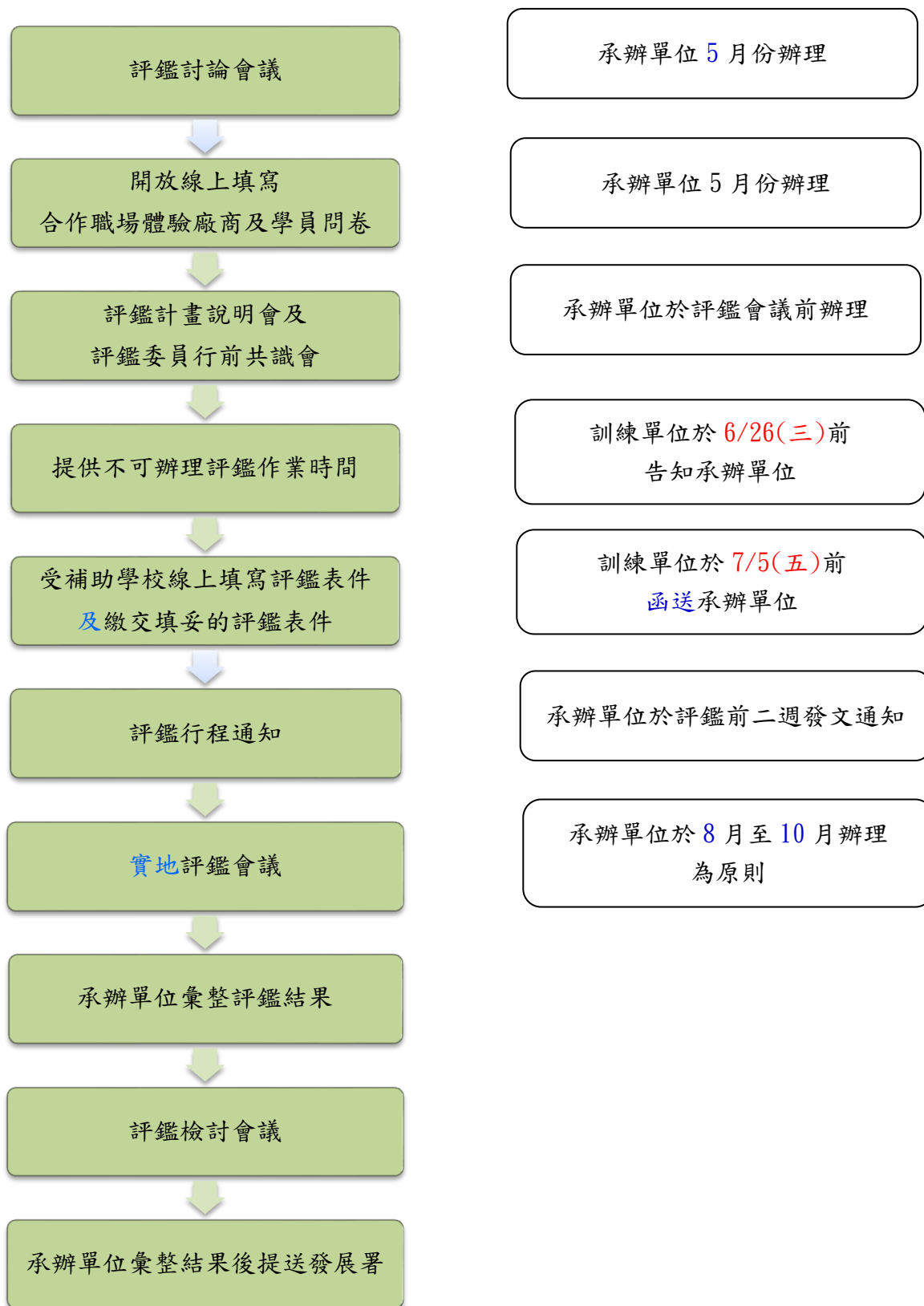
圖 1：評鑑作業流程圖