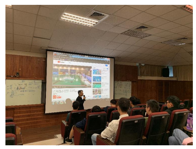
說明：周博士講述擔任世大運游泳館經理的經驗