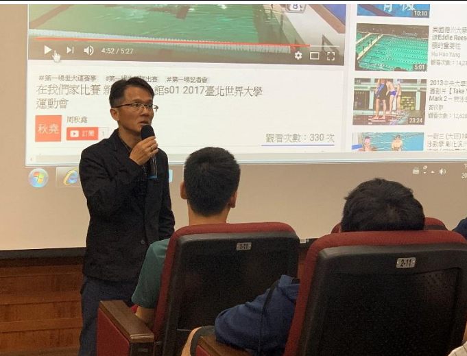
說明：周博士講述擔任世大運游泳館經理的經驗