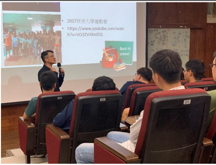
說明：周博士說明水球比賽的過程及與運動員合照