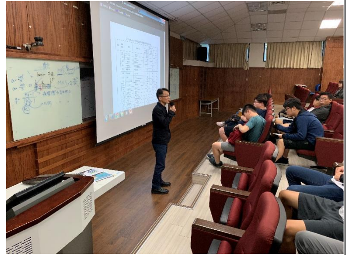
說明：周博士運用網站資料說明景觀建築專業政府需求的缺額