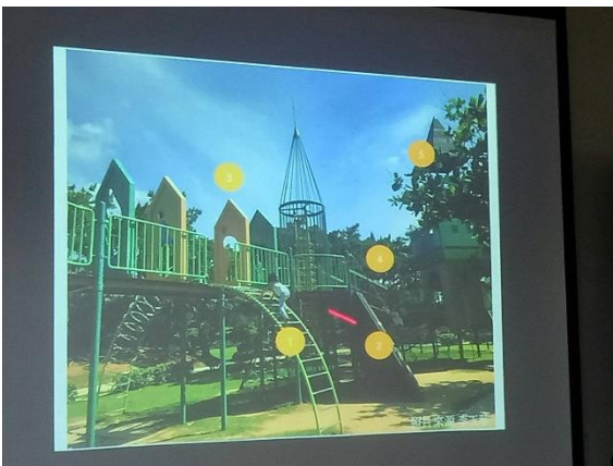
說明：介紹景觀與遊具