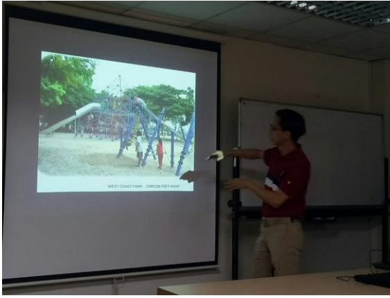
說明：講者進行演講中