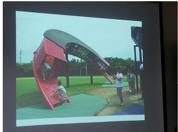
說明：介紹景觀與遊具