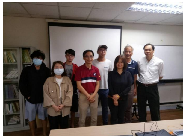
說明：講者與老師、同學們大合照