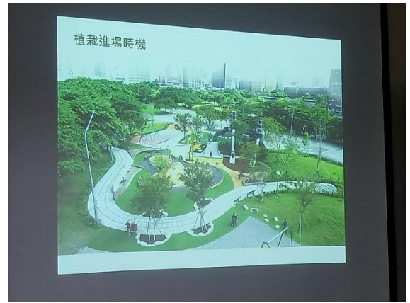
說明：介紹景觀與遊具