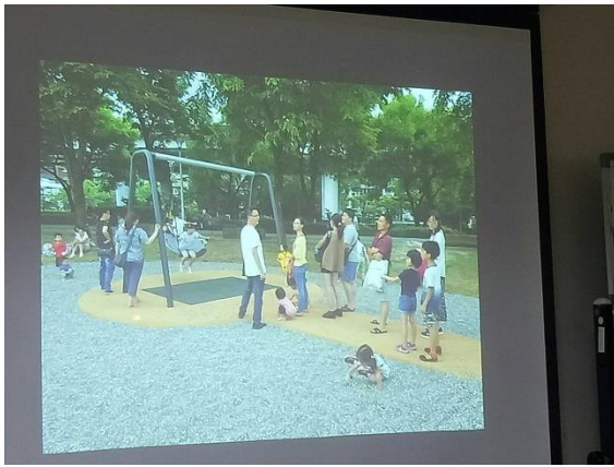
說明：介紹景觀與遊具