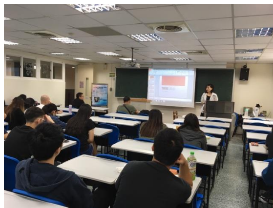
說明：講者與聽眾交流