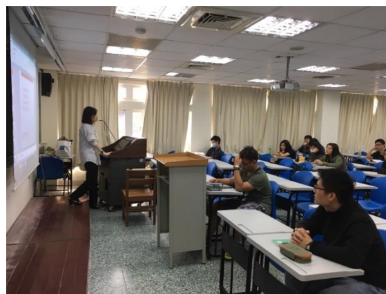
說明：講者專心演講