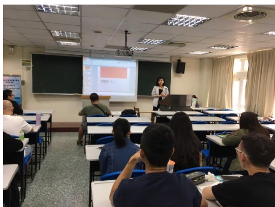
說明：聽眾專心聆聽